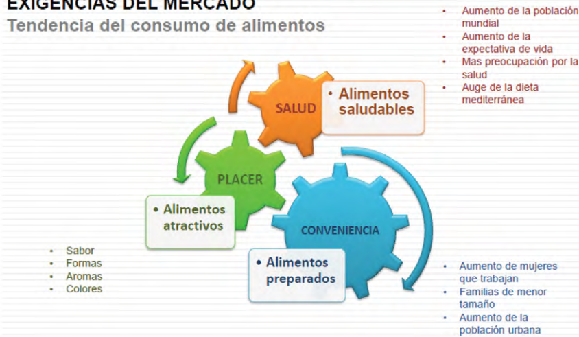
Fig. 1. Tendencia del consumo de alimentos 2 .

En la actualidad, la tendencia del consumo de alimentos está orientada hacia los alimentos saludables. Si se toma en cuenta que hay un aumento de la población mundial, con nuevas generaciones que transitan hacia una mejor calidad de vida – que incluye una nueva forma de alimentarse, con un incremento de la expectativa de vida y mayor preocupación por la salud– en el corto plazo, la demanda por productos que contribuyan al bienestar se incrementará y se debe estar preparado para hacer frente a la demanda de productos sanos.