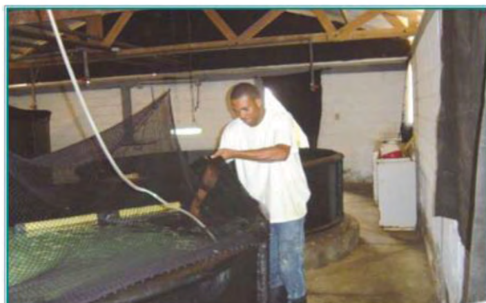
Fig. 3 Zona de cuarentena para peces.