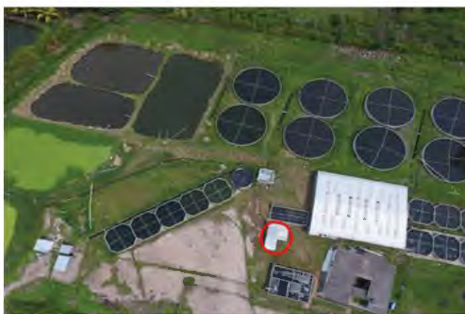
Fig. 4 Área de cuarentena en una instalación acuícola.