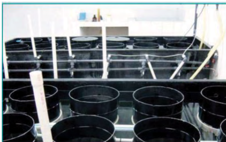
Fig. 2 Zona de cuarentena para nauplios de camarones.